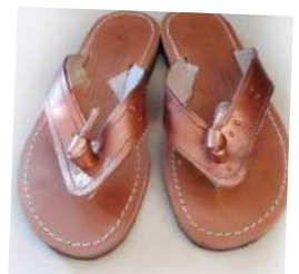
βάψιμο σε δερμάτινα σανδάλια