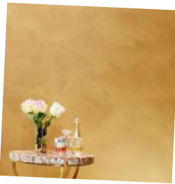
Τοίχοι & τραπεζαρίες