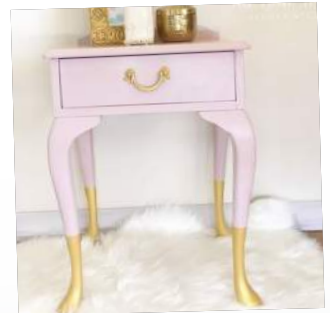
Τεχνική Gold dip σε σπόδια του κομοδίνου

Χρυσή Βουτιά! Δοκιμάστε και εσείς το χρυσό trend που κάνει θραύση στο χώρο του DIY. Με τα Acualux και λίγη χαρτοταινία μπορείτε να προσθέσετε μεταλλικό χρώμα στα ποδαράκια μικρών ή μεγαλύτερων επίπλων όπως: κομοδίνα, τραπέζια, καρέκλες συρταριέρες, και σκαμπό.