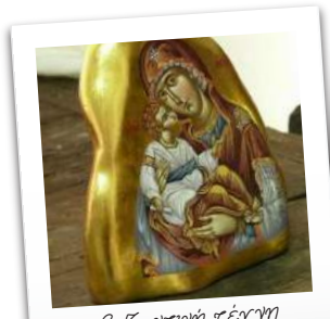
βυζαντινή τέχνη & αιογραφίες