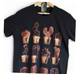
ζωγραφική σε T-shirt