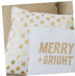
μαξιθάρια & υφάσματα