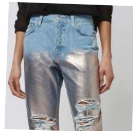
πάνω σε τζιν