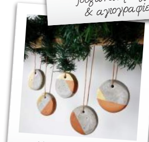
Χριστουγεννιάτικα σοφίδια DIY