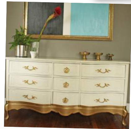
Σε αντών τον σαβίλο βενκό μπεουφέ, το Gold Dip έφτασε μέχρι τα συρτάρια!

Τα μεταλλικά Acualux είναι ιδανικά για τη διακόσμηση τοίχων και γύψινων, αλλά και των ανάγλυφων πάνω σε έπιπλα και άλλες επιφάνειες